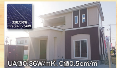
太陽光発電 システム 5.5kW