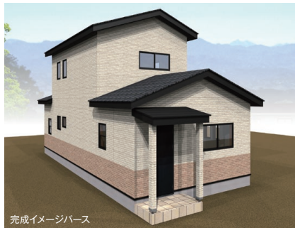
完成イメージパース