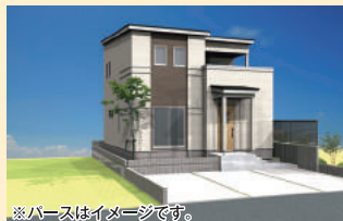
※パースはイメージです。