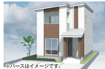
※パースはイメージです。